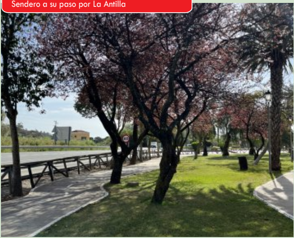
Sendero a su paso por La Antilla

Junta de Andalucía Consejería de Turismo, Cultura y Deporte