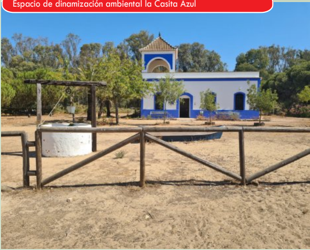
Espacio de dinamización ambiental la Casita Azul